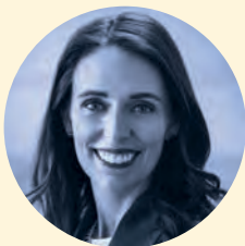
Jacinda Ardern, Kryeministre e Zelandës së Re