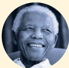
Nelson Mandela (1994)